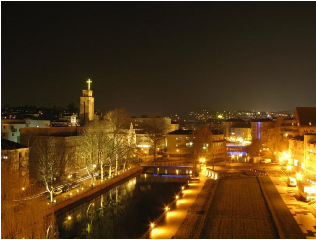
Pforzheim bei Nacht